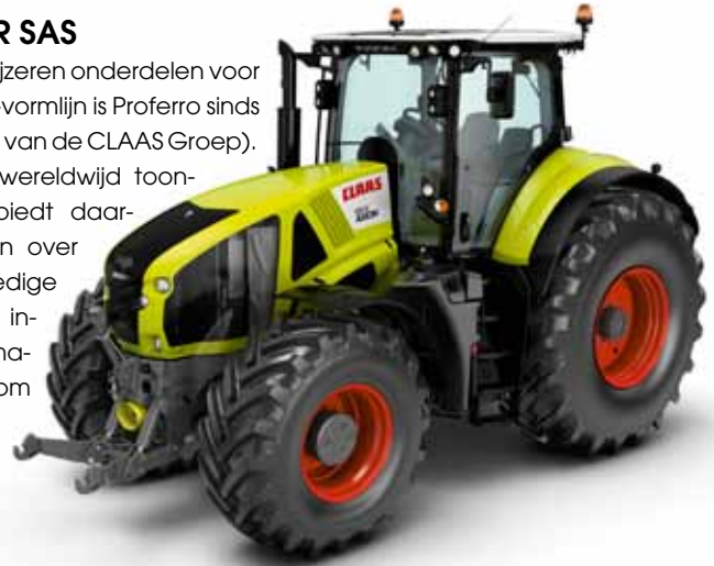
(foto: De CLAAS-trekker van Le Mans - een krachtig vervoermiddel).

Proferro is al meer dan 20 jaar een belangrijke leverancier van gietijzere onderdelen voor de landbouwmachinesector. Met de opstart van de nieuwe HWS-vormlijn is Proferro sinds 2010 ook leverancier geworden van CLAAS Tractor SAS (onderdeel van de CLAAS Groep). De CLAAS Groep, met hoofdzetel in Harsewinkel (D), is een wereldwijd toonaangevende fabrikant van landbouwmachines. De groep biedt daarnaast ook verschillende industriële engineering producten aan over de hele wereld. Zo verkoopt CLAAS sinds 2003 ook een volledige reeks tractoren. Betrouwbaarheid, doorzettingsvermogen en innovatie zijn de kwaliteiten die van CLAAS een sterke partner maken voor de landbouwindustrie. Proferro is dan ook erg trots om als leverancier bij te dragen aan het groeiende succes van de vermaarde CLAAS-tractoren. Momenteel levert Proferro onderdelen in nodulair gietijzer, zoals frontkoppelingondersteuning en chassis, voor CLAAS Axion 900 tractoren die in de CLAAS-vestiging in Le Mans (Frankrijk) geassembleerd worden.